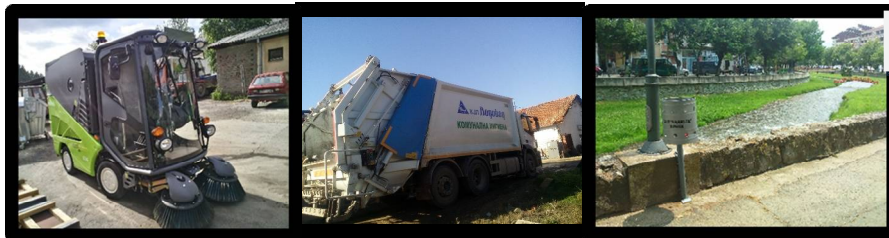
Сектор Комунална хигиена