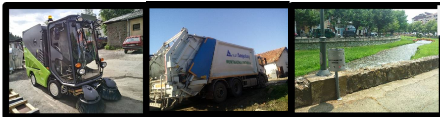
Сектор Комунална хигиена