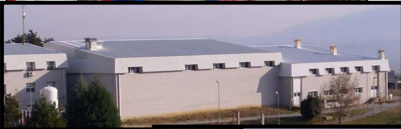
Сектор Водовод и канализација